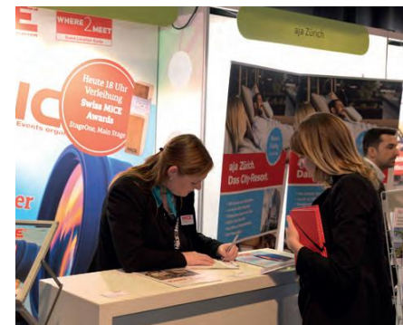
Regelbetrieb an den Ständen.