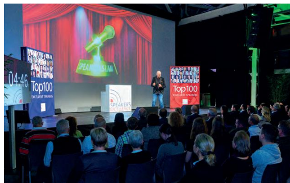
Teilnehmer am Speakers Excellence Slam 2019.